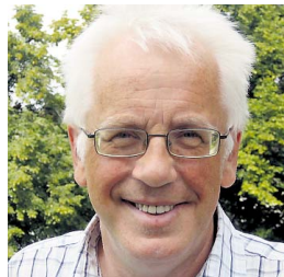
UTFORDRANDE «Europa er i dag i ein svært utfordrande demokratisk situasjon.»