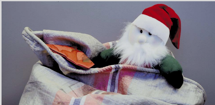
Posten: Jula nærmer seg, og da doubles postmengdene. Rådet er som alltid før å være ute i god tid og merke all post tydelig med navn og adresse.