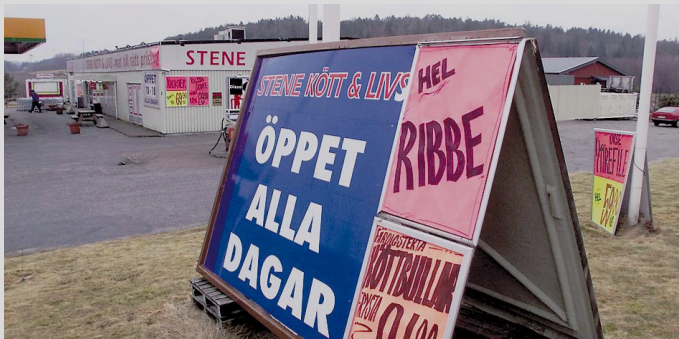
Grensehandel: Statistisk sentralbyrå legger fram tall for grensehandelen for 3. kvartal.