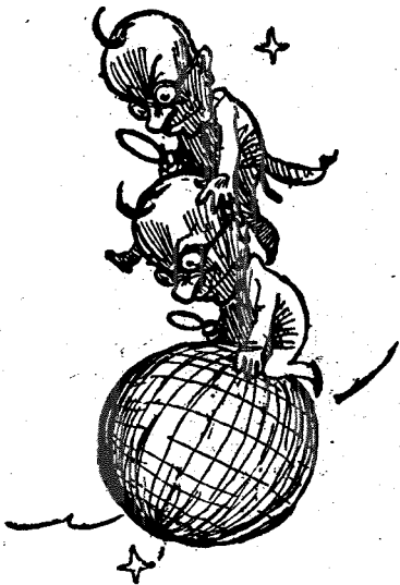
G. K. Chesterton Biografi og geografi.