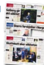
Klassekampen 24. og 28. juni og 3. juli