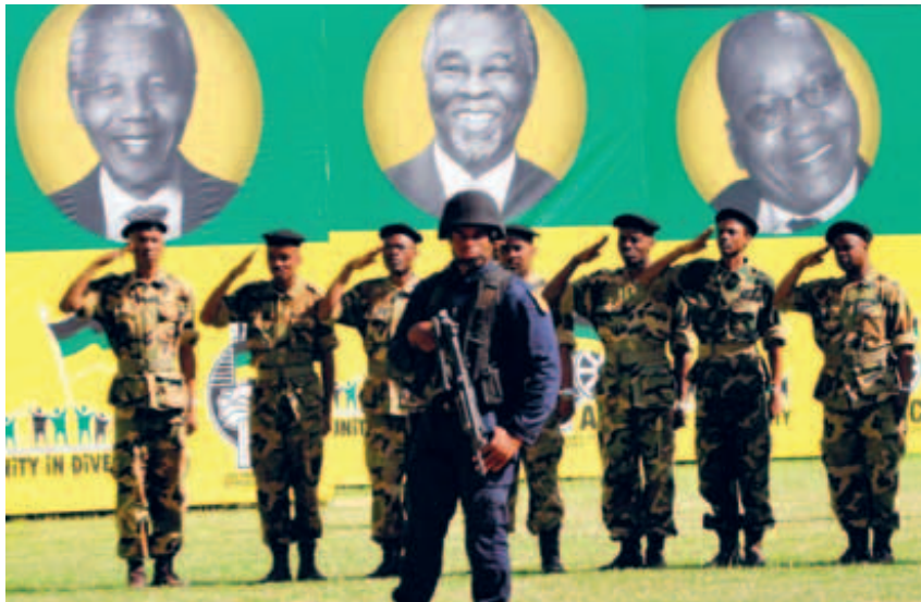
INGEN MIRAKELMEDISIN. African National Congress (ANC) feiret sin hundreårsdag sist helg. Men etter 18 år ved makten har ANC ikke mye å vise til på det økonomiske området.

Et aktuelt eksempel er Sør-Afrika. Som kjent markerte African National Congress (ANC) sin hundreårsdag sist helg. Afrikas eldste frigjøringsbevegelse har mye å feire: Avskaffelsen av det rasistiske apartheidstyret, innføringen av demokratiske rettigheter for alle og en overveldende seier ved alle politiske valg siden