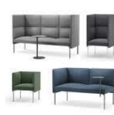
Sofa / stoler aktiv sone