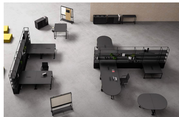
Arbeidsbord / romdeling