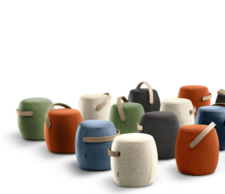
Puffer i aktiv sone