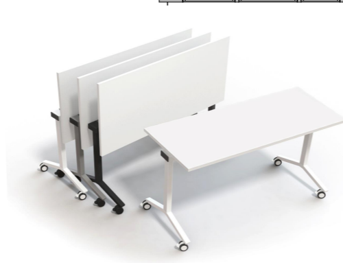
Sammenleggbare bord på hjul