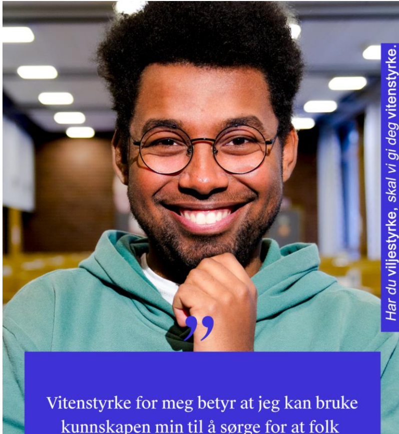
Har du viljestyrke, skal vi gi deg vitenstyrke.

Vitenstyrke for meg betyr at jeg kan bruke kunnskapen min til å sørge for at folk