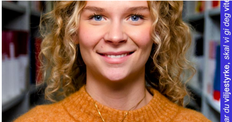
Har du viljestyrke, skal vi gi deg vitenstyrke.