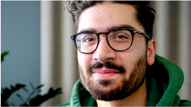
Vitenstyrke, skal vi gi deg vitenstyrke