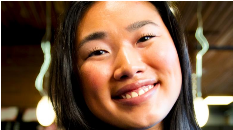
Vitenstyrke, skal vi gi deg vitenstyrke