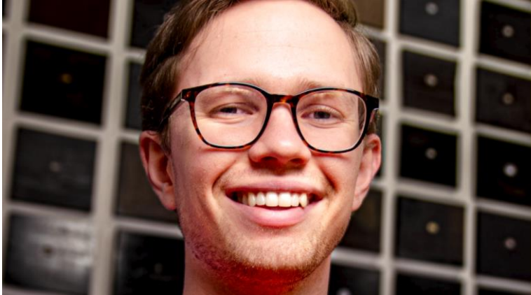
Vitenstyrke, skal vi gi deg vitenstyrke